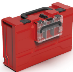
METABOX 63XS VERBUNDEN MIT DEM METABOX 185XL KOFFER