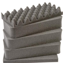
1431 5 St. Ersatz- Schaumstoffeinsätze