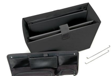
1436 Office Divider Kit