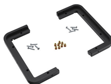
1430PF Panelrahmen für Spezialanwendungen