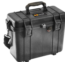
1430NF No Foam