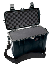
1430WF With Foam