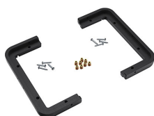
1430PF Cadre de panneau pour application spéciale