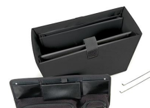
1436 Trousse de séparateurs bureau