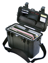
1437 With Padded Office Divider Set & Lid Organizer