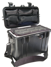
1434 With Padded Dividers & Lid Organizer