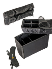
1435 Cloison en mousse