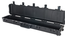
iM3410-X0000 No Foam