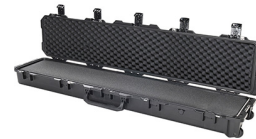
iM3410-X0001 With Foam