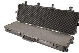
iM3300-X0001 With Foam