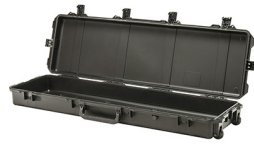
iM3300-X0000 No Foam