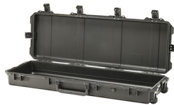
iM3200-X0000 No Foam