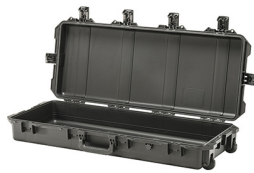
iM3100-X0000 No Foam