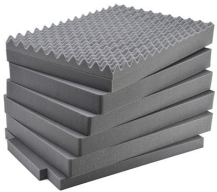
iM3075-FOAM Jeu de mousses de rechange, 7 pièces