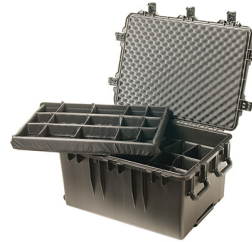
iM3075-X0002 With Padded Dividers