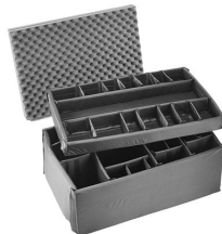
iM3075-DIV Cloison en mousse