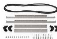
iM2620-M4-BEZEL-L Deckel-Lünette (metrisch)