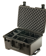
iM2620-X0002 With Padded Dividers