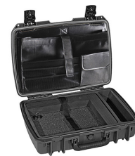
iM2370-X0003 Computer Case Deluxe