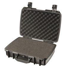
iM2370-X0001 With Foam