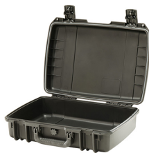
iM2370-X0000 No Foam