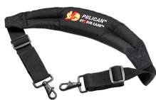
iM2370-STRAP-S Bandoulière rembourrée amovible