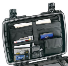
iM2370-UTILITYORG Pochette utilitaire