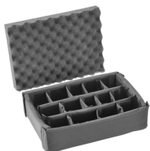
iM2200-DIV Cloison en mousse