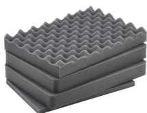
iM2200-FOAM Jeu de mousses de rechange, 4 pièces