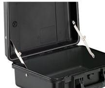
iM-LIDSTAY Compas de couvercle