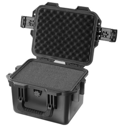
iM2075-X0001 With Foam