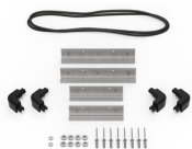
iM20XX-M4-BEZEL Lunette de base (métrique)