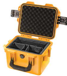
iM2075-X0002 With Padded Dividers