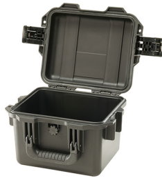
iM2075-X0000 No Foam