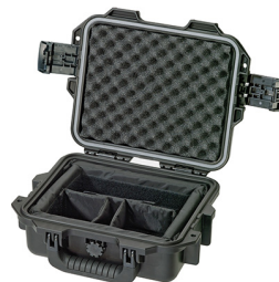
iM2050-X0002 With Padded Dividers