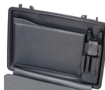
1498 Classeur à compartiments pour couvercle d'ordinateur