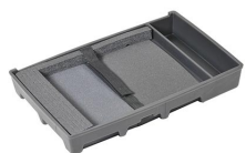
1499C Fond insérable pour ordinateur