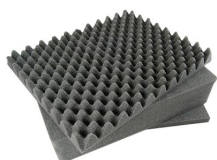
1491 Jeu de mousses de rechange, 3 pièces