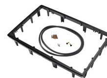
1490PF Cadre de panneau pour application spéciale