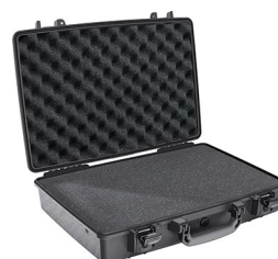
1490WF With Foam