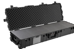
1770WF With Foam