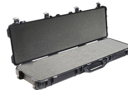
1750WF With Foam