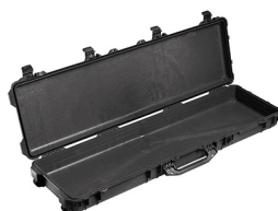
1750NF No Foam