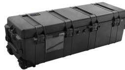
1740NF No Foam