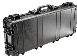
1700NF No Foam