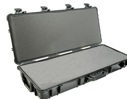
1700WF With Foam