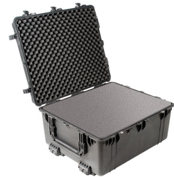
1690WF With Foam