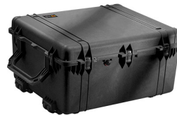
1690NF No Foam