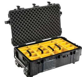
1674 With Padded Dividers