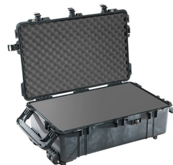
1670WF With Foam