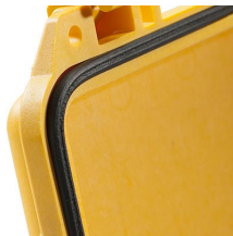
1623 Joint torique de remplacement