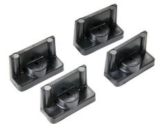
1507 Supports rapides - jeu de 4