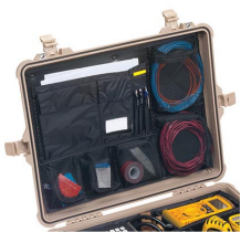
1609 Pochette couvercle