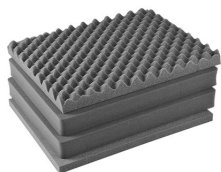
1601 4 St. Ersatz-Schaumstoffeinsätze