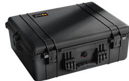
1600NF No Foam