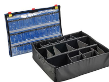
1605EMS EMS Accessory Set (Lid Organizer and Divider Set)