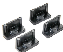
1507 Supports rapides - jeu de 4