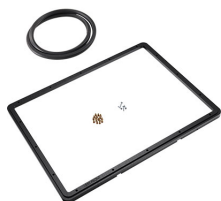
1550PF Panelrahmen für Spezialanwendungen