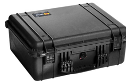
1550NF No Foam