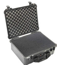
1550WF With Foam