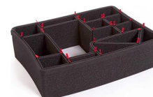
1550EUTP TrekPak Koffer Teiler Kit