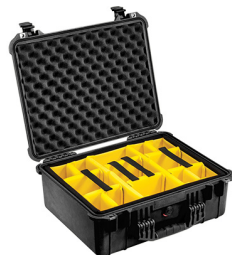
1554 With Padded Dividers