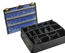
1555EMS EMS Accessory Set (Lid Organizer and Divider Set)