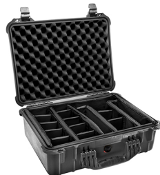
1524 With Padded Dividers