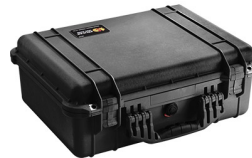
1520NF No Foam