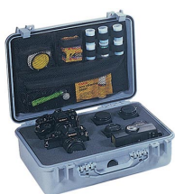
1508 Deckeleinteiler für Fotografen