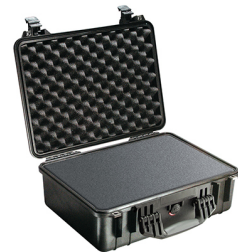
1520WF With Foam