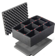
1520TPKIT Kit de séparation de la valise TrekPak