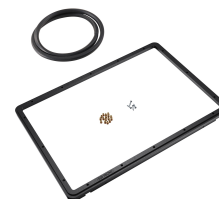
1520PF Cadre de panneau pour application spéciale