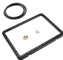
1400PF Cadre de panneau pour application spéciale