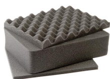
1401 Jeu de mousses de rechange, 3 pièces