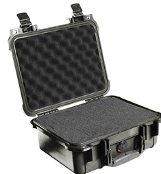
1400WF With Foam