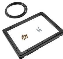
1200PF Panelrahmen für Spezialanwendungen