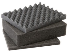
1201 3 St. Ersatz-Schaumstoffeinsätze