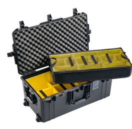
1626WD With Padded Dividers