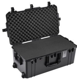
1626WF With Foam