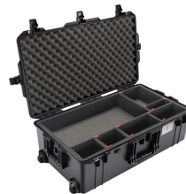
1615TP With TrekPak Divider System