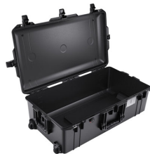
1615NF No Foam