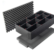
1615TPKIT Kit de séparation de la valise TrekPak