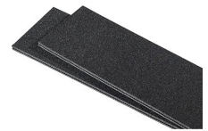
1615TPDIV Séparateurs TrekPak supplémentaires