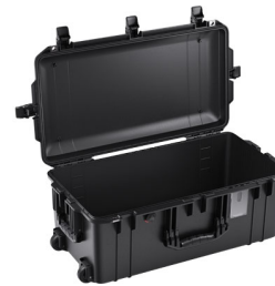
1606NF No Foam