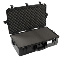
1605WF With Foam