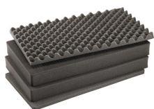
1605AirFS Jeu de mousses de rechange, 4 pièces