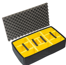
1605AirDS Cloison en mousse