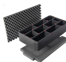
1605TPKIT Kit de séparation de la valise TrekPak