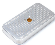
1500D Gel de silice dessicant