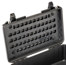
1535MP EZ-Click™ MOLLE Panel