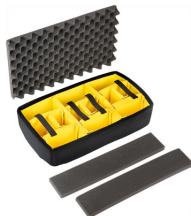
1535AirDS Cloison en mousse