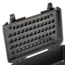
1535MP EZ-Click™ MOLLE Panel