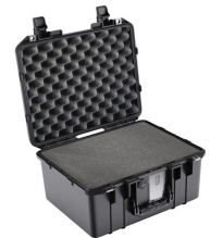
1507WF With Foam