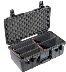
1506TP With TrekPak Divider System