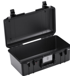
1506NF No Foam