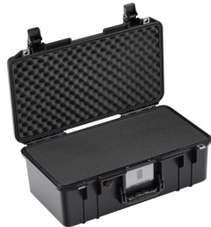
1506WF With Foam