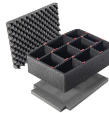
1485TPKIT Kit de séparation de la valise TrekPak