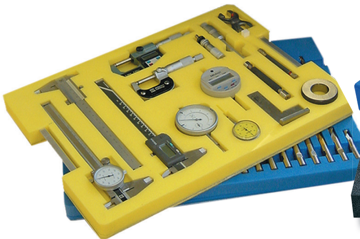
wassestrahl geschnittene Einlagen

Mehrweg-Verpackungen besitzen eine robuste Schale. Deshalb werden hier vor allem Koffer- oder Behälterlösungen der Wellpappe vorgezogen. Mit massgeschneiderten Schaumstoff-Einlagen sind Ihre Produkte auch über Jahre hinweg sicher geschützt!